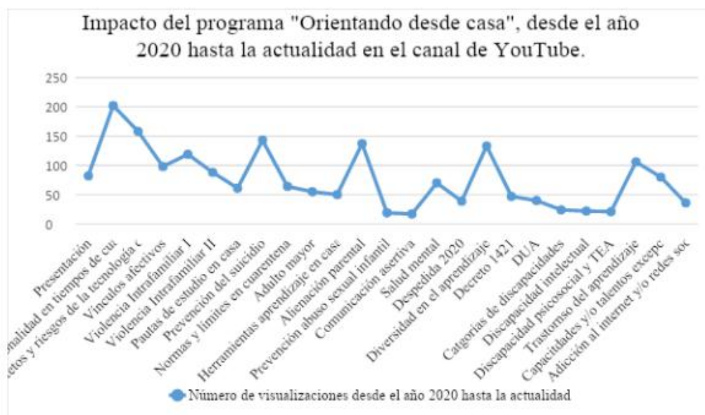
Figura 3 Impacto del programa "Orientando desde casa" desde el año 2020 hasta la actualidad en el canal de YouTube.

A continuación, se puede apreciar el impacto que ha tenido el programa, si lo medimos desde el número de reproducciones de acuerdo con las temáticas que se encuentran ordenadas desde la primera que corresponde a la presentación oficial del programa, hasta la última que corresponde a la temática de "adicción al internet y/o a las redes sociales".