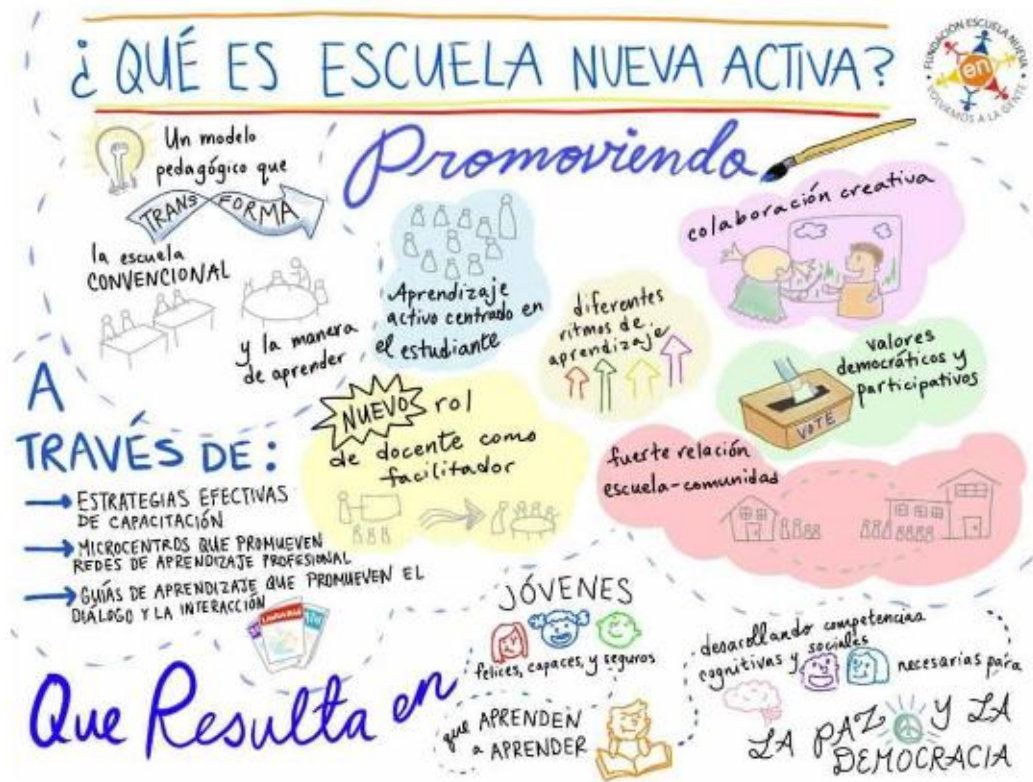
Figura 2. Modelo Pedagógico Escuela Nueva Activa